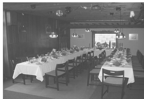
30-43 couvert ved u-bord

Bordplan ved 43 couvert. Ved mindre couverter anbefales 4 på langs ved hovedbordet