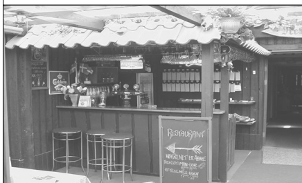
"UDENDØRS BAR PÅ TERRASSEN".

I 60-erne og op til starten af 70-erne var Løjtehus stedet, hvor der var dans hver fredag og lørdag. Man mødtes i Restaurant "Amagerstuen", hvor man hyggede sig med smørrebrød, øl & snaps, for så at gå ind ved siden af, for at ta' en lille svingom. Af andre moti-onsmuligheder var der de ofte be-nyttede keglebaner i baghaven, som var en stor modedille i 70-erne.