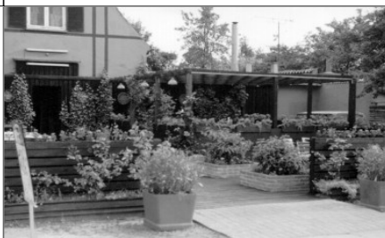
"LØJTEHUS I 80'ERNE".

I 50-erne var det et yndet sted at gå hen, efter man havde været til hestevæddeløb på travbanen, som lå et par hundrede meter fra Løjtehus. Det er blevet fortalt, at hvis en af hestene manglede sin kusk, var det mest nærliggende at kigge i billardsalonen på Løjtehus først, da det var her kuskenes interne væddemål foregik.