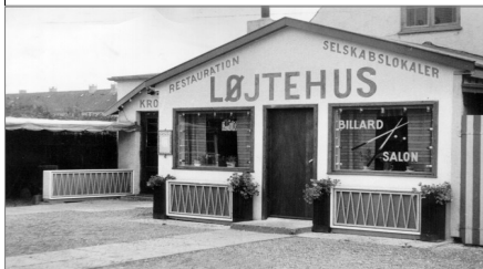
"LØJTEHUS I 50' & 60'ERNE".

I 50-erne var det et yndet sted at gå hen, efter man havde været til hestevæddeløb på travbanen, som lå et par hundrede meter fra Løjtehus. Det er blevet fortalt, at hvis en af hestene manglede sin kusk, var det mest nærliggende at kigge i billardsalonen på Løjtehus først, da det var her kuskenes interne væddemål foregik.