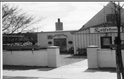
"LØJTEHUS I 40'ERNE".

Løjtehus, som blev bygget i 1934, har været rammen om mange folkelige begivenheder for amars beboere i en menneskealder. Det har fungeret som et hyggeligt samlingssted, hvor blandt andet Tårby Selskabelige Dramatiske Forening, i daglig tale kaldet "Dramaten", holdt til i 30- & 40-erne. Hver fredag mødtes den tids unge til dans og amatørteater, samt det hyggelige samvær.