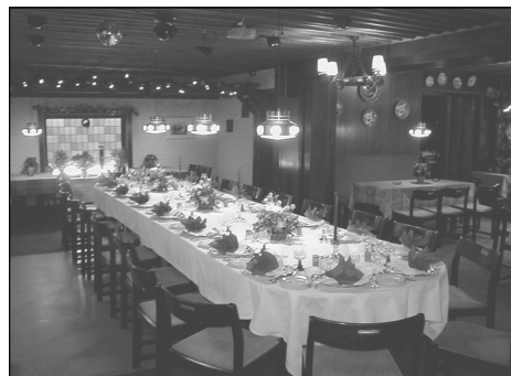
12-30 cou. ved et aflangt bord

Se mere på www.lojtenhus.dk for aktuelle tilbud.